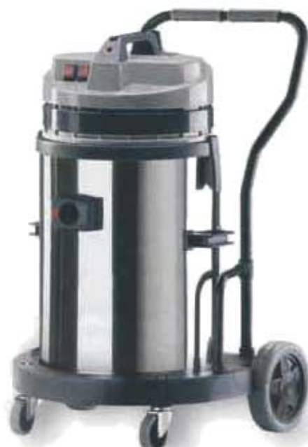
1429 M / 1440 M